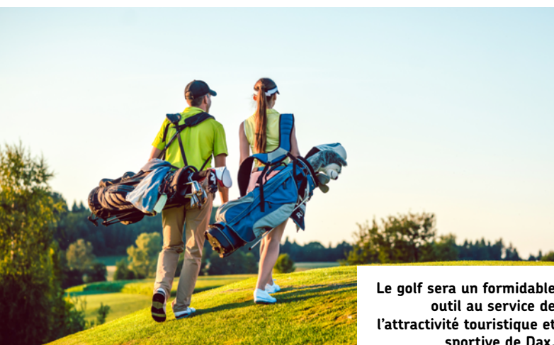
Le golf sera un formidable outil au service de l'attractivité touristique et sportive de Dax.