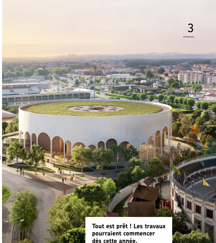
© Atelier Ferret architectures - Grand Dax Agglomération

Tout est prêt ! Les travaux pourraient commencer dès cette année.