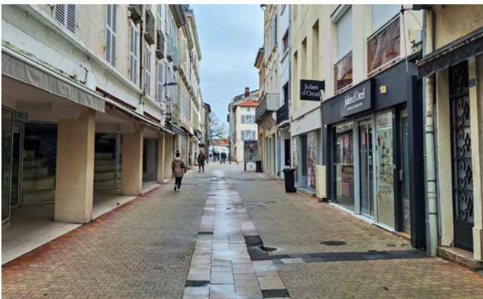
Après la réfection de 80% du plateau piétonnier lors de ce mandat, nous continuerons à rénover les rues dégradées non encore refaites dans le centre-ville.