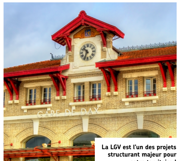
La LGV est l'un des projets structurant majeur pour notre territoire !