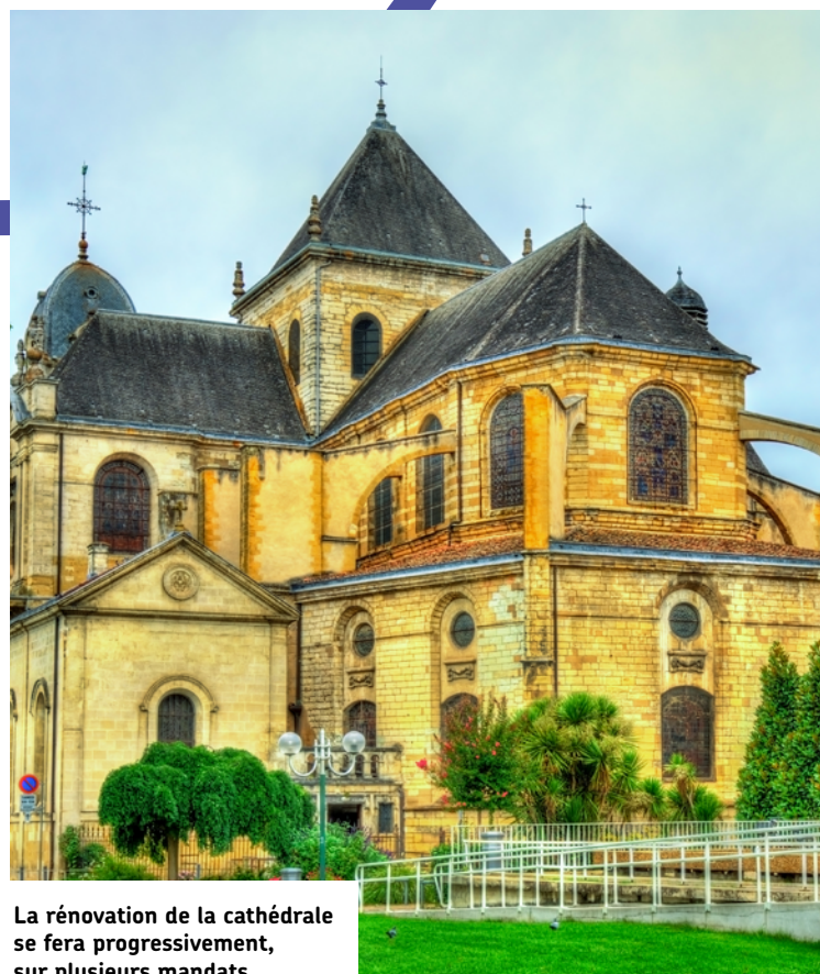
La rénovation de la cathédrale se fera progressivement, sur plusieurs mandats.