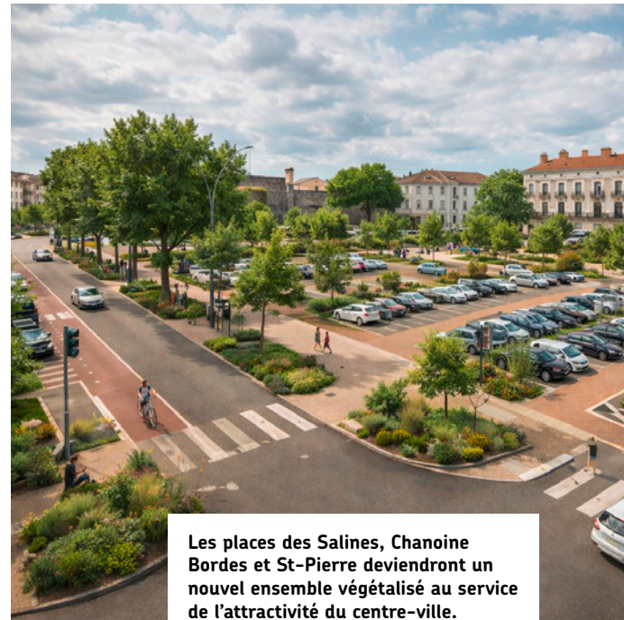
Les places des Salines, Chanoine Bordes et St-Pierre deviendront un nouvel ensemble végétalisé au service de l'attractivité du centre-ville.