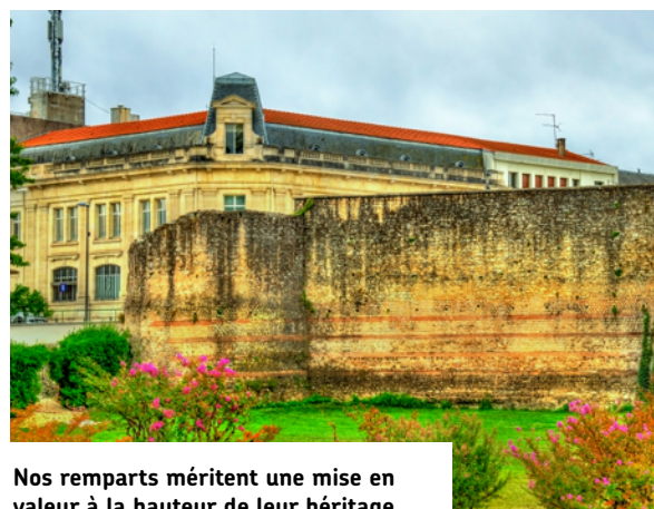
Nos remparts méritent une mise en valeur à la hauteur de leur héritage.